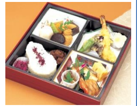
告別式お膳 20 名