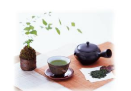
返礼品 25 セット