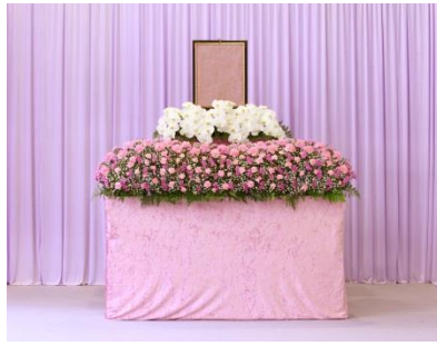
花祭壇 A タイプの場合