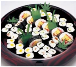
通夜料理 25 名様対応分

各祭壇に下記項目が共通して含まれます。人数の超過が無ければ追加料金はありません。