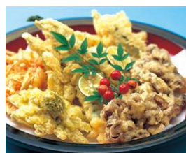
寿司・揚げ物・煮物・香の物